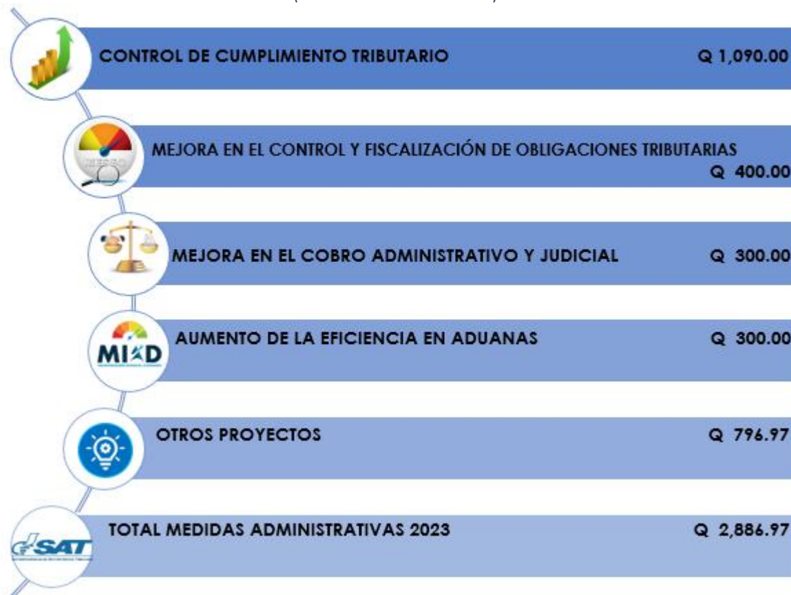
Tabla 1 Medidas Administrativas Programadas (Millones de Quetzales)

*Pueden existir diferencias por redondeo