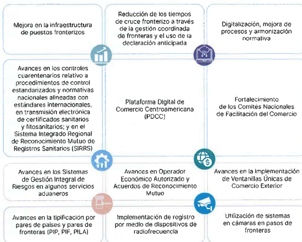
Tabla 1: Hitos de impacto implementados en la ECFCC-2015 2

En 2020, los países con el apoyo de la SIECA elaboraron un informe de diagnóstico regional del avance en la implementación en la ECFCC-2015. En la tabla 1 se muestra un resumen de los principales hitos de impacto implementados.