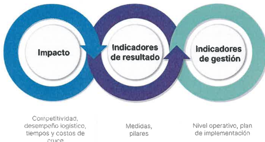
Figura 6: Tipo de indicadores

El principal propósito de los indicadores de resultado es medir la manera en que los objetivos están aportando a los pilares y las medidas, y estas a su vez, a las acciones que sustentan la estrategia.