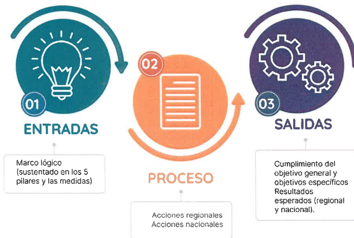
Figura 5: Esquema de entradas, proceso y salidas