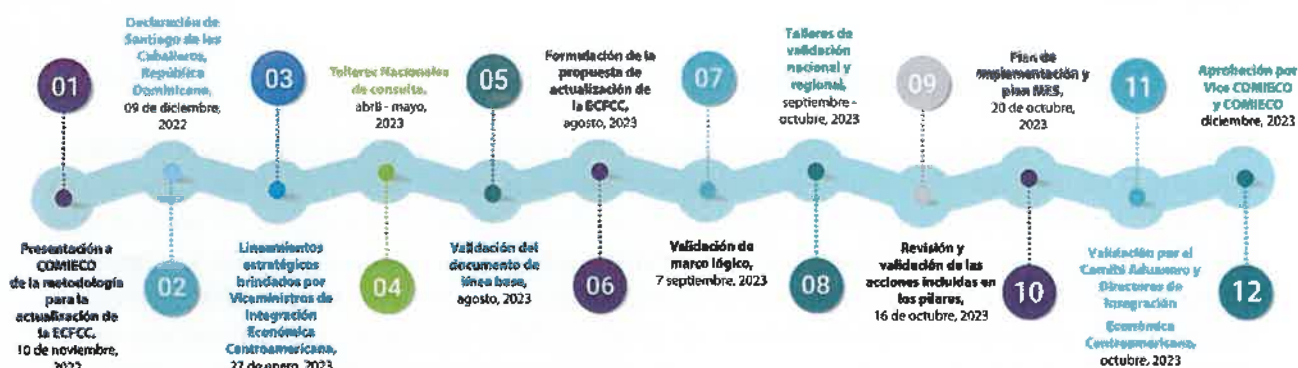
Figura 1: Hitos del proceso de actualización de la ECFCC

El proceso de actualización de la ECFCC-2023, contó con la coordinación del Grupo de Trabajo Permanente conformado por un delegado de los Ministerios de Economía/Comercio Exterior y un delegado de los Servicios Aduaneros de cada país, e incluyó seis talleres nacionales de consulta, seis talleres de validación nacional, un taller de validación regional con la participación de los sectores público y privados, así como las principales agencias de control con presencia en las fronteras y autoridades vinculadas con el comercio exterior.