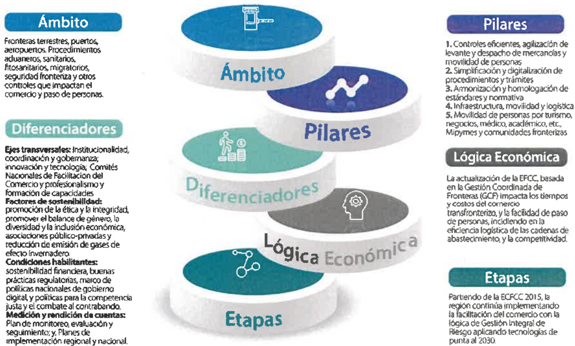
Figura 2. Alcance, diferenciadores y lógica económica

La implementación de las medidas contempladas en la ECFCC-2023 para puertos y aeropuertos se realizará en el marco de los planes de implementación nacional o por pares de países, de conformidad a los avances y estrategias de logística y transporte, marcos legales, operativos y contractuales, aplicados por las autoridades competentes nacionales.