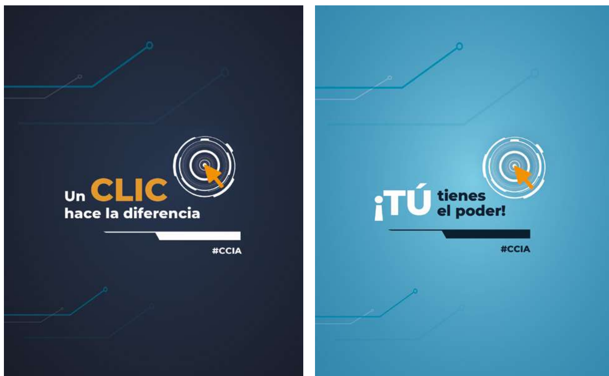
Imagen 8. Clic, el poder anticorrupción. Publicación expectativa