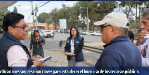
Las verificaciones sorpresa son claves para establecer el buen uso de los recursos públicos