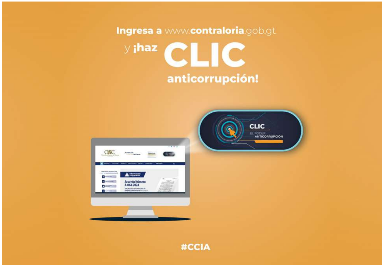
Imagen 17. Clic, el poder anticorrupción. Publicación