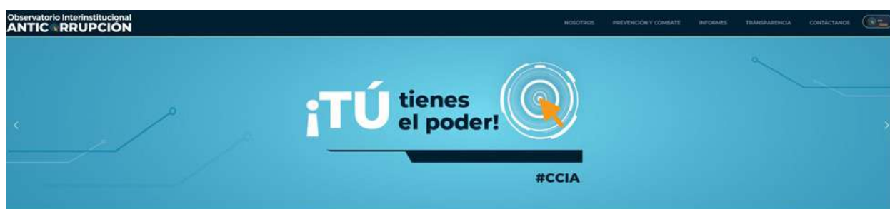
Imagen 3. Observatorio Interinstitucional Anticorrupción. Página principal

El Observatorio Interinstitucional Anticorrupción atiende uno de los compromisos adquiridos por las partes firmantes del presente convenio 3 . Esta plataforma digital fue creada para dar a conocer a la población guatemalteca y a quien se interese, los proyectos y actividades desarrolladas en el convenio, en pro de la prevención y combate a la corrupción. Asimismo, para informar otros aspectos relevantes, como las buenas prácticas interinstitucionales en la materia.