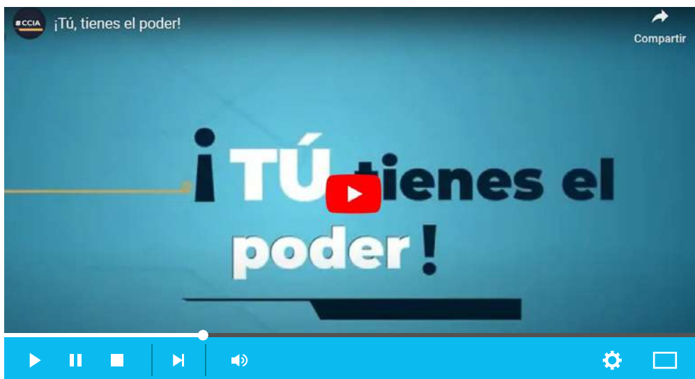
Imagen 11. Clic, el poder anticorrupción. Vídeo horizontal: ¡Tú, tienes el poder!