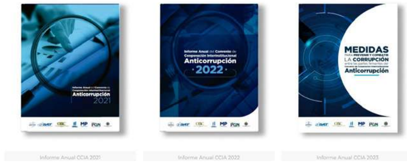
Imagen 5. Observatorio Interinstitucional Anticorrupción. Informes CCIA

La plataforma incluye el botón Clic, el poder anticorrupción cuyo propósito es denunciar actos de corrupción e incumplimiento ético, cometidos por funcionarios y empleados públicos para que sean investigados y sancionados administrativa o penalmente.