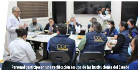
Personal participa en una verificación en una de las Instituciones del Estado

Las acciones se dan en el marco de la estrategia de prevención contra la corrupción impulsada por el Dr. Bode Fuentes, que tiene como prioridad la mejora en la prestación de servicios que las Instituciones del Estado brindan a la ciudadanía en todos los departamentos del país.