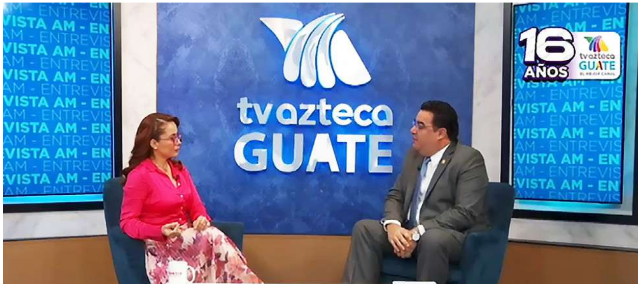
Imagen 12. Clic, el poder anticorrupción. Entrevista Tv Azteca Guate