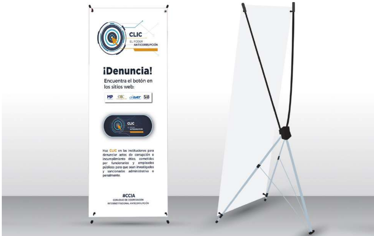
Imagen 15. Clic, el poder anticorrupción. Banner