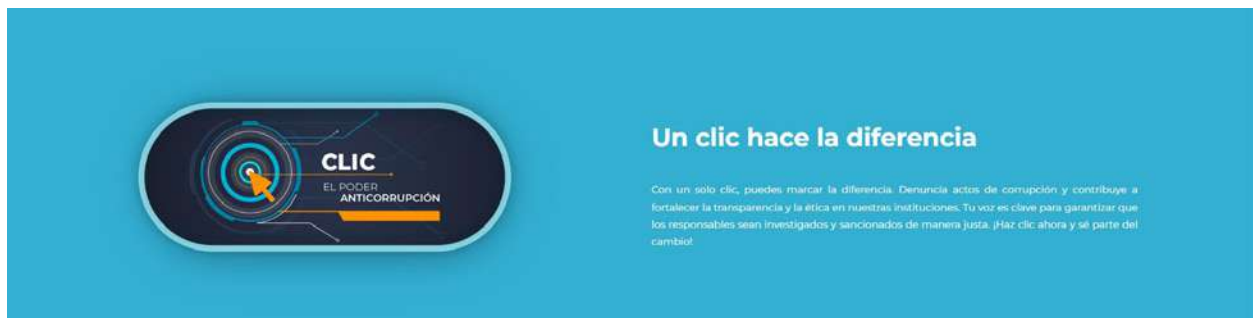
Imagen 6. Observatorio Interinstitucional Anticorrupción. Clic, el poder anticorrupción

La plataforma incluye el botón Clic, el poder anticorrupción cuyo propósito es denunciar actos de corrupción e incumplimiento ético, cometidos por funcionarios y empleados públicos para que sean investigados y sancionados administrativa o penalmente.