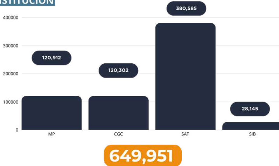
Gráfica 1. Clic, el poder anticorrupción. Alcance por institución