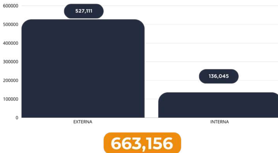
Gráfica 2. Clic, el poder anticorrupción. Alcance comunicación externa / interna