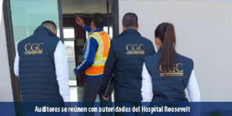
Auditores se reúnen con autoridades del Hospital Roosevelt