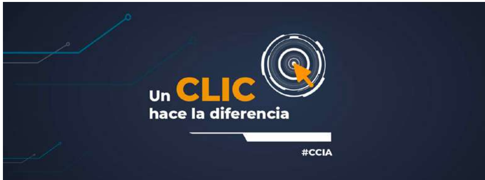
Imagen 9. Clic, el poder anticorrupción. Cover FB