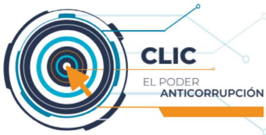
Imagen 19. Clic, el poder anticorrupción. Trifoliar (tiro)

El #CCIA impulsa acciones y proyectos a través de la instauración de procedimientos de coordinación y asistencia interinstitucional para el fortalecimiento de la prevención y lucha contra la corrupción de conformidad con la normativa legal vigente, cumpliendo con los compromisos pactados dentro del marco de su competencia y capacidad.