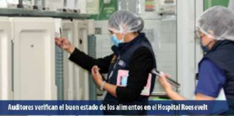
Auditores verifican el buen estado de los alimentos en el Hospital Roosevelt