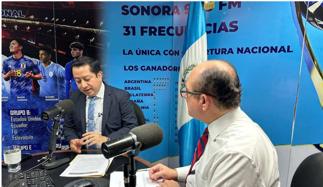
Imagen 13. Clic, el poder anticorrupción. Entrevista Radio Sonora