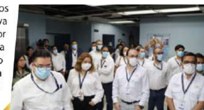
Personal se ubica en el Hospital General San Juan de Dios para monitoreo

Es preciso resaltar que el programa no contempla la realización de auditorías que deriven en algún tipo de acción legal, sino que se enfoca específicamente en el monitoreo que permite obtener información oportuna sobre los servicios públicos que prestan las instituciones públicas en los municipios del país.