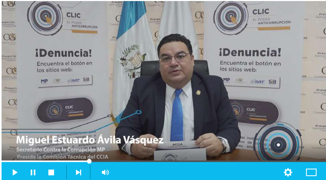
Imagen 14. Clic, el poder anticorrupción. Video lanzamiento pregrabación