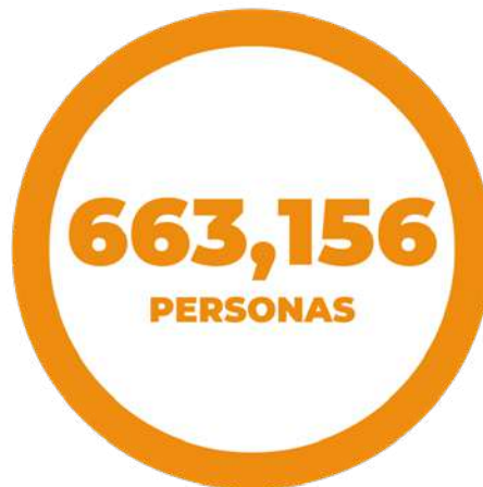
Gráfica 4. Clic, el poder anticorrupción. Alcance total