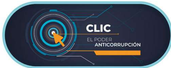
Imagen 16. Clic, el poder anticorrupción. Botón