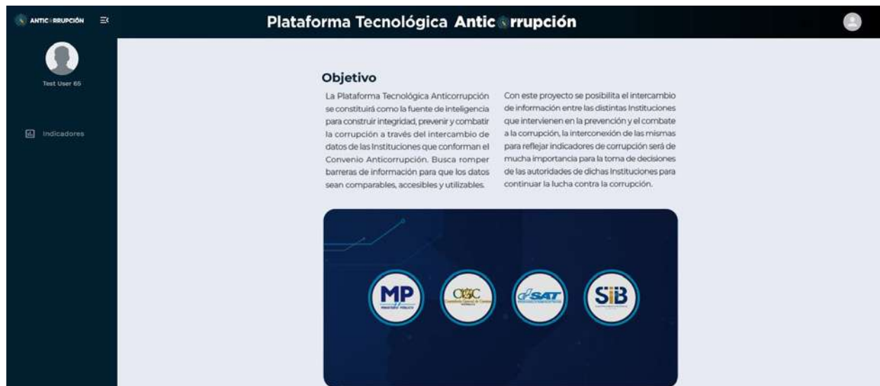
Imagen 2. Plataforma Tecnológica Anticorrupción. Página interior