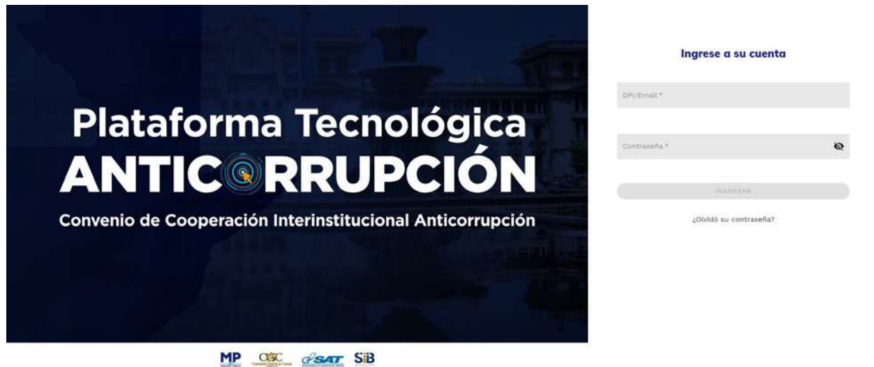
Imagen 1. Plataforma Tecnológica Anticorrupción. Ingreso de cuenta