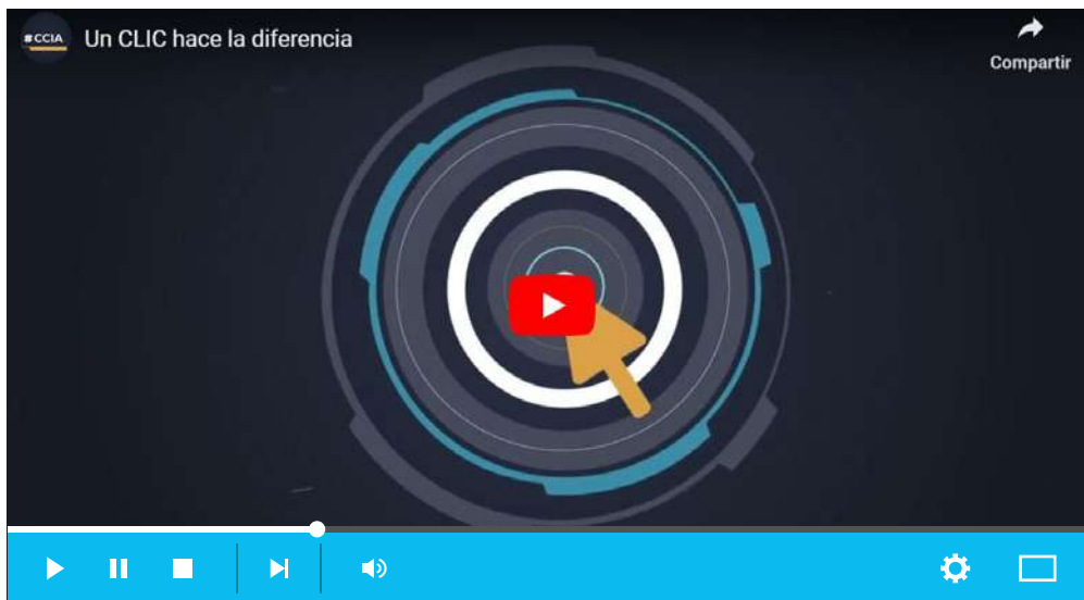
Imagen 10. Clic, el poder anticorrupción. Vídeo horizontal: Un CLIC hace la diferencia