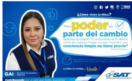
SAT Comunicación Interna: ¿Cómo vives la ética? Alcance: 7000 personas, aprox. Guatemala, 7 de febrero de 2023