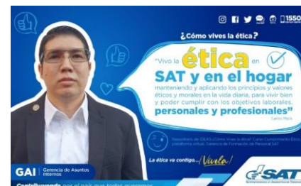
SAT Comunicación Interna: ¿Cómo vives la ética? Alcance: 7000 personas, aprox. Guatemala, 16 de febrero de 2023