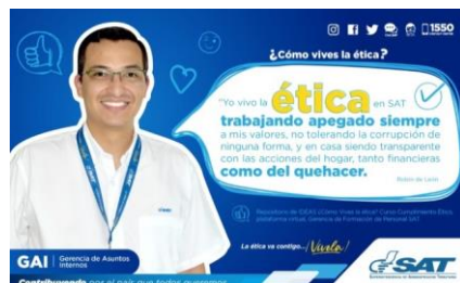
SAT Comunicación Interna: ¿Cómo vives la ética? Alcance: 7000 personas, aprox. Guatemala, 2 de marzo de 2023