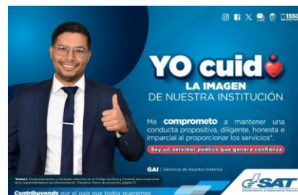
SAT Comunicación Interna: Yo cuido. LA IMAGEN DE NUESTRA INSTITUCIÓN. Alcance: 7000 personas, aprox. Guatemala, 08 de septiembre de 2023