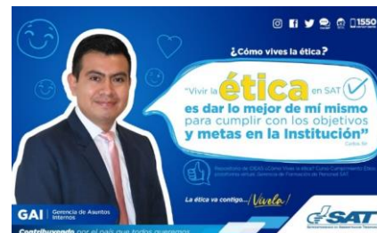
SAT Comunicación Interna: ¿Cómo vives la ética? Alcance: 7000 personas, aprox. Guatemala, 23 de febrero de 2023