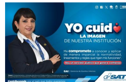
SAT Comunicación Interna: Yo cuido. LA IMAGEN DE NUESTRA INSTITUCIÓN. Alcance: 7000 personas, aprox. Guatemala, 11 de septiembre de 2023