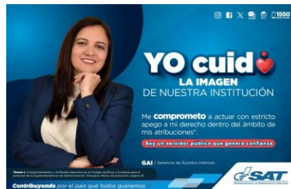
SAT Comunicación Interna: Yo cuido. LA IMAGEN DE NUESTRA INSTITUCIÓN. Alcance: 7000 personas, aprox. Guatemala, 06 de septiembre de 2023