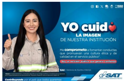
SAT Comunicación Interna: Yo cuido. LA IMAGEN DE NUESTRA INSTITUCIÓN. Alcance: 7000 personas, aprox. Guatemala, 04 de septiembre de 2023