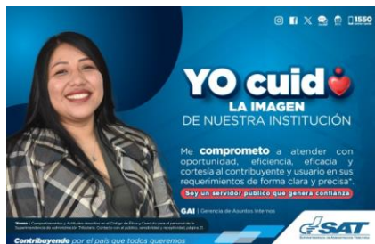
SAT Comunicación Interna: Yo cuido. LA IMAGEN DE NUESTRA INSTITUCIÓN. Alcance: 7000 personas, aprox. Guatemala, 20 de septiembre de 2023