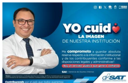
SAT Comunicación Interna: Yo cuido. LA IMAGEN DE NUESTRA INSTITUCIÓN. Alcance: 7000 personas, aprox. Guatemala, 25 de septiembre de 2023