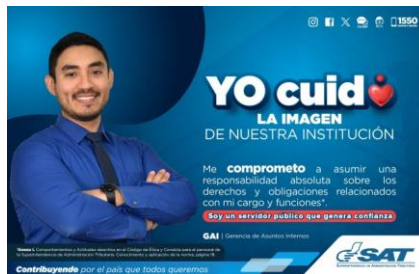
SAT Comunicación Interna: Yo cuido. LA IMAGEN DE NUESTRA INSTITUCIÓN. Alcance: 7000 personas, aprox. Guatemala, 13 de septiembre de 2023