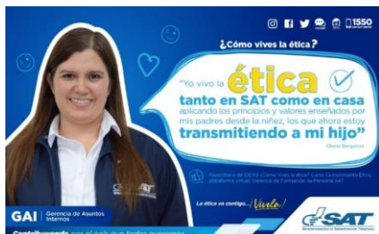
SAT Comunicación Interna: ¿Cómo vives la ética? Alcance: 7000 personas, aprox. Guatemala, 28 de febrero de 2023