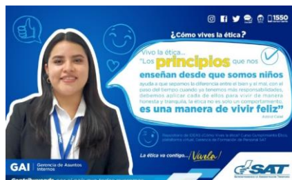
SAT Comunicación Interna: ¿Cómo vives la ética? Alcance: 7000 personas, aprox. Guatemala, 8 de marzo de 2023