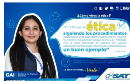
SAT Comunicación Interna: ¿Cómo vives la ética? Alcance: 7000 personas, aprox. Guatemala, 14 de febrero de 2023