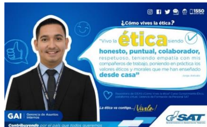
SAT Comunicación Interna: ¿Cómo vives la ética? Alcance: 7000 personas, aprox. Guatemala, 3 de febrero de 2023