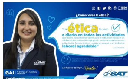
SAT Comunicación Interna: ¿Cómo vives la ética? Alcance: 7000 personas, aprox. Guatemala, 21 de febrero de 2023