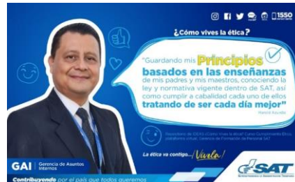
SAT Comunicación Interna: ¿Cómo vives la ética? Alcance: 7000 personas, aprox. Guatemala, 9 de febrero de 2023