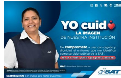
SAT Comunicación Interna: Yo cuido. LA IMAGEN DE NUESTRA INSTITUCIÓN. Alcance: 7000 personas, aprox. Guatemala, 18 de septiembre de 2023