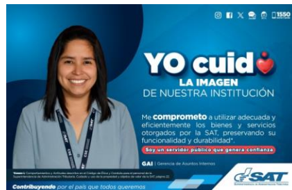
SAT Comunicación Interna: Yo cuido. LA IMAGEN DE NUESTRA INSTITUCIÓN. Alcance: 7000 personas, aprox. Guatemala, 22 de septiembre de 2023