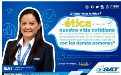
SAT Comunicación Interna: ¿Cómo vives la ética? Alcance: 7000 personas, aprox. Guatemala, 1 de febrero de 2023