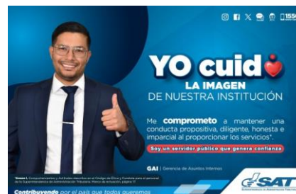
SAT Comunicación Interna: Yo cuido. LA IMAGEN DE NUESTRA INSTITUCIÓN. Alcance: 7000 personas, aprox. Guatemala, 08 de septiembre de 2023