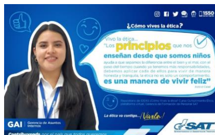
SAT Comunicación Interna: ¿Cómo vives la ética? Alcance: 7000 personas, aprox. Guatemala, 8 de marzo de 2023