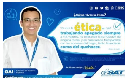
SAT Comunicación Interna: ¿Cómo vives la ética? Alcance: 7000 personas, aprox. Guatemala, 2 de marzo de 2023