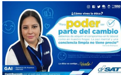
SAT Comunicación Interna: ¿Cómo vives la ética? Alcance: 7000 personas, aprox. Guatemala, 7 de febrero de 2023