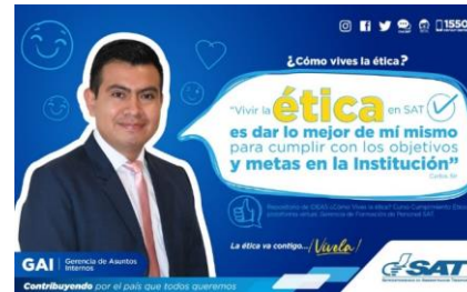
SAT Comunicación Interna: ¿Cómo vives la ética? Alcance: 7000 personas, aprox. Guatemala, 23 de febrero de 2023