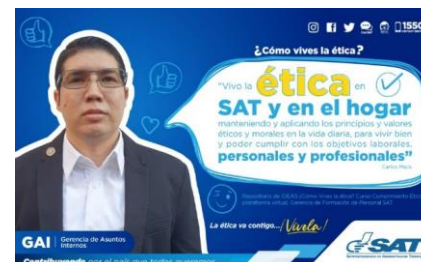
SAT Comunicación Interna: ¿Cómo vives la ética? Alcance: 7000 personas, aprox. Guatemala, 16 de febrero de 2023