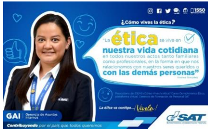
SAT Comunicación Interna: ¿Cómo vives la ética? Alcance: 7000 personas, aprox. Guatemala, 1 de febrero de 2023