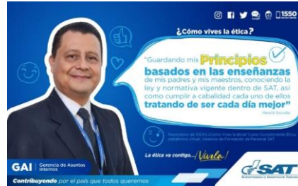
SAT Comunicación Interna: ¿Cómo vives la ética? Alcance: 7000 personas, aprox. Guatemala, 9 de febrero de 2023