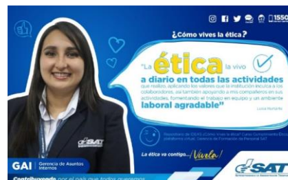
SAT Comunicación Interna: ¿Cómo vives la ética? Alcance: 7000 personas, aprox. Guatemala, 21 de febrero de 2023