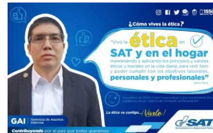
SAT Comunicación Interna: ¿Cómo vives la ética? Alcance: 7000 personas, aprox. Guatemala, 16 de febrero de 2023