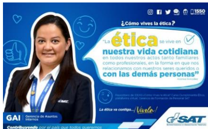
SAT Comunicación Interna: ¿Cómo vives la ética? Alcance: 7000 personas, aprox. Guatemala, 1 de febrero de 2023