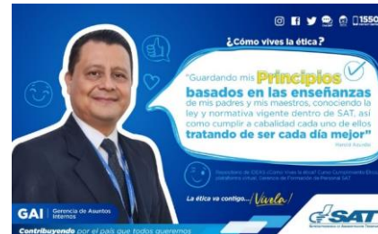
SAT Comunicación Interna: ¿Cómo vives la ética? Alcance: 7000 personas, aprox. Guatemala, 9 de febrero de 2023