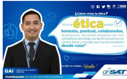
SAT Comunicación Interna: ¿Cómo vives la ética? Alcance: 7000 personas, aprox. Guatemala, 3 de febrero de 2023