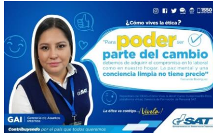
SAT Comunicación Interna: ¿Cómo vives la ética? Alcance: 7000 personas, aprox. Guatemala, 7 de febrero de 2023