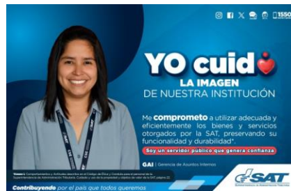
SAT Comunicación Interna: Yo cuido. LA IMAGEN DE NUESTRA INSTITUCIÓN. Alcance: 7000 personas, aprox. Guatemala, 22 de septiembre de 2023