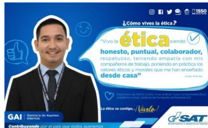
SAT Comunicación Interna: ¿Cómo vives la ética? Alcance: 7000 personas, aprox. Guatemala, 3 de febrero de 2023