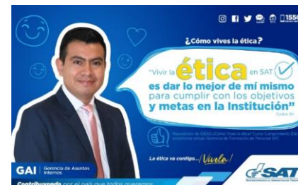
SAT Comunicación Interna: ¿Cómo vives la ética? Alcance: 7000 personas, aprox. Guatemala, 23 de febrero de 2023