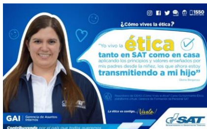
SAT Comunicación Interna: ¿Cómo vives la ética? Alcance: 7000 personas, aprox. Guatemala, 28 de febrero de 2023