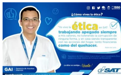
SAT Comunicación Interna: ¿Cómo vives la ética? Alcance: 7000 personas, aprox. Guatemala, 2 de marzo de 2023