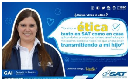
SAT Comunicación Interna: ¿Cómo vives la ética? Alcance: 7000 personas, aprox. Guatemala, 28 de febrero de 2023