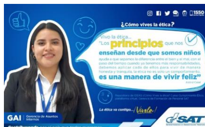
SAT Comunicación Interna: ¿Cómo vives la ética? Alcance: 7000 personas, aprox. Guatemala, 8 de marzo de 2023