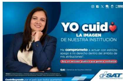
SAT Comunicación Interna: Yo cuido. LA IMAGEN DE NUESTRA INSTITUCIÓN. Alcance: 7000 personas, aprox. Guatemala, 06 de septiembre de 2023