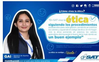
SAT Comunicación Interna: ¿Cómo vives la ética? Alcance: 7000 personas, aprox. Guatemala, 14 de febrero de 2023