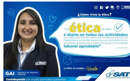
SAT Comunicación Interna: ¿Cómo vives la ética? Alcance: 7000 personas, aprox. Guatemala, 21 de febrero de 2023